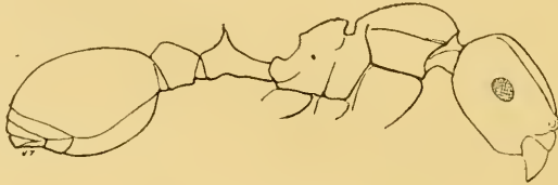
Atopomyrmex Foreli , Emery ♀

Nell' A. Steinheili , le lamine frontali si prolungano indietro in una cresta acuta che raggiunge gli angoli posteriori del capo; nella nuova specie, dall'estremo posteriore delle lamine frontali agli angoli del capo, corre un cercine o spigolo smusato che non interrompe le rughe longitudinali. Queste sono più grossolane nella nuova specie e tutte dirette longitudi-